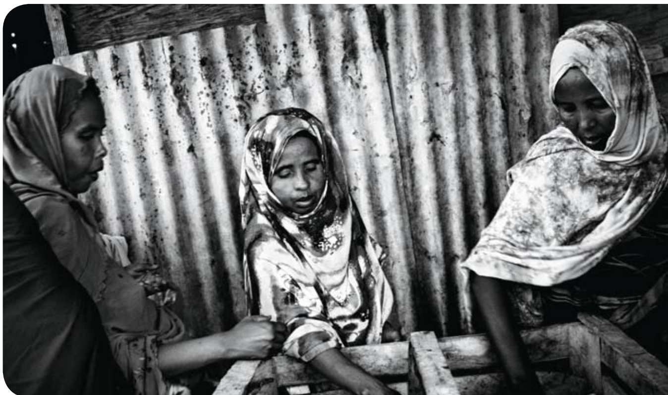
© STARVEDFORATTENTION - DJIBOUTI - BLEASDALE - 022-2919

▣ «Η τροφή που δεν θα δίναμε ποτέ στα παιδιά μας στέλνεται ως επισιτιστική βοήθεια στα πιο ευάλωτα παιδιά σε χώρες της υπο-σαχάριας Αφρικής και της Ασίας που απειλούνται από υποσιτισμό. Αυτή η διάκριση πρέπει να σταματήσει», λέει ο Διεθνής Πρόεδρος των ΓΧΣ, Δρ Ούνι Καρουνακάρα. Τα περισσότερα επισιτιστικά προγράμματα στις αναπτυσσόμενες χώρες στηρίζονται σε συστατικά, όπως το σιτάρι, που δεν πληρούν τα διεθνή πρότυπα για την κάλυψη των διατροφικών αναγκών των παιδιών κάτω των 2 ετών.