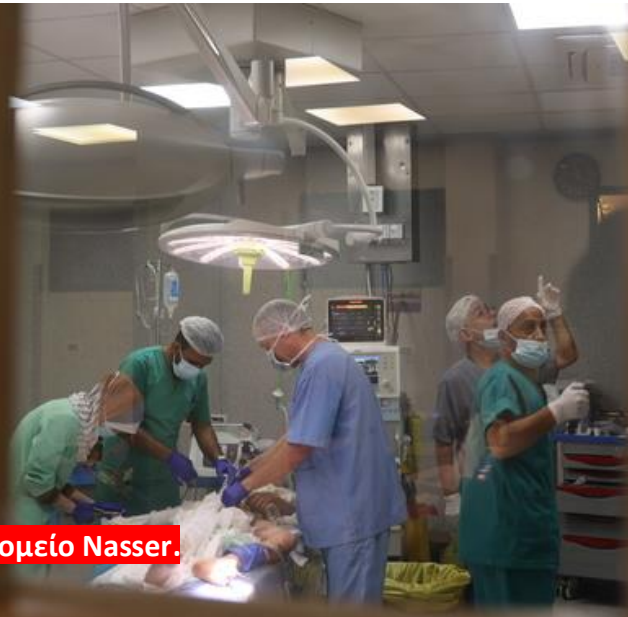
Χειρουργική αίθουσα στο νοσοκομείο Nasser.