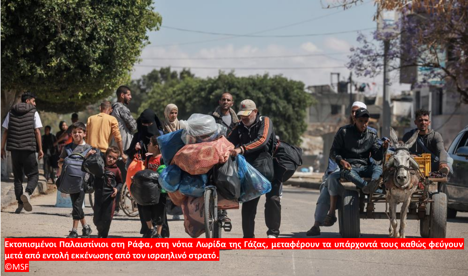
Εκτοπισμένοι Παλαιστίνιοι στη Ράφα, στη νότια Λωρίδα της Γάζας, μεταφέρουν τα υπάρχοντά τους καθώς φεύγουν μετά από εντολή εκκένωσης από τον ισραηλινό στρατό.